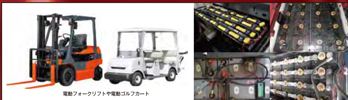
電動フォークリフトや電動ゴルフカート