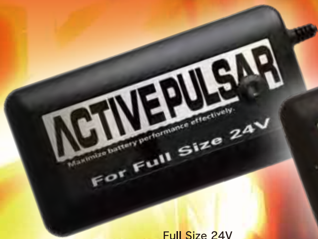
Full Size 24V